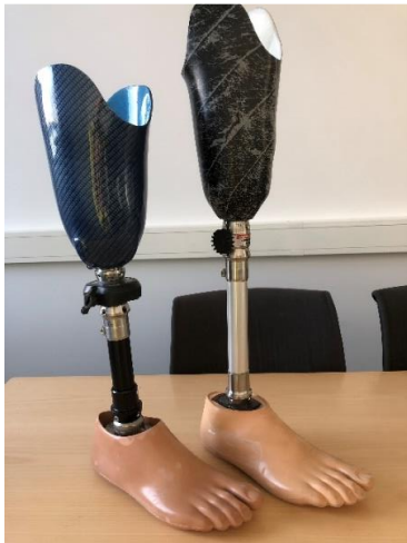
Figur 2. Proteser som användes vid intervjuutillfället, för demonstrering av snabbkopplingsadaptorna. Till vänster, Otto Bock's Quickchange. Till höger, Lindhe Xtend's Xtend Connect.

Snabbkopplingsadaptorn användes mellan proteshylsa och protesfot enligt Figur 2.