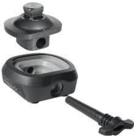
Figur 1a. Otto Bocks Quickchange omonterad

Examensarbetet började i januari 2020 och var färdigställt i maj 2020. Datainsamlingen gjordes under en tvåveckorsperiod i februari. För att undersöka behovet av snabbkopplingsadapterar utfördes semistrukturella intervjuer av fenomenologisk karaktär, eftersom det är ett specifikt fenomen (snabbkopplingsadapterns nödvändighet) som utreds och deltagarna utgår ifrån sina egna erfarenheter som protesbrukare vilket ligger i linje med metodvalet. Fenomenologisk metod är ett bra sätt att bilda sig en generell uppfattning om ett specifikt ämne baserat på känslor och erfarenheter, samt ger deltagare möjlighet att uttrycka sig helt fritt om fenomenet i fråga (Rosberg, 2017; Smith, 2009). Analys och tolkning av insamlade data gjordes sedan vidare enligt Interpretative Phenomenological Analysis (IPA). Vid intervjutillfället fanns både Otto Bocks Quickchange (Figur 1a) och Lindhe Xtends Xtend Connect (Figur 1b) monterade på färdiga proteser enligt leverantörernas instruktioner, för en inledande demonstration och förklaring av dess funktion.